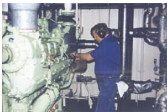
Fra fyrbøder.....Til mekaniker