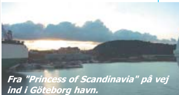
Fra "Princess of Scandinavia" på vej ind i Göteborg havn.