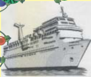
Bornholms Trafikkens Efterløns - Pensionistklub.

Receptionen finder sted på Velfærdskontoret, Århusgade 88, 6. sal, 2100 København Ø