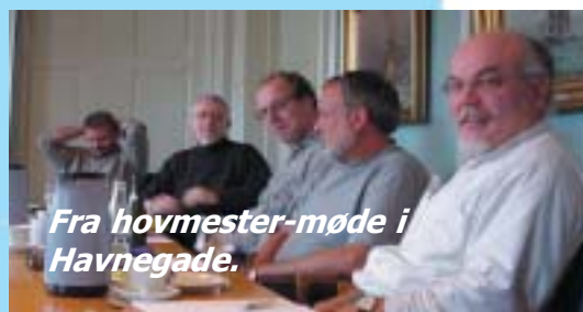
Fra hovmester-møde i Havnegade.