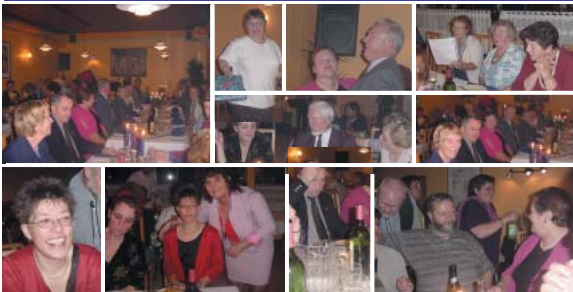
Billederne er fra den bornholmske skovtur.

at Ankenævnet ved at give sagsøgeren karantæne uberettiget har „taget arbejdsgiverens part“, hvilket er i strid med formålet med arbejdsløshedsforsikringsordningen.